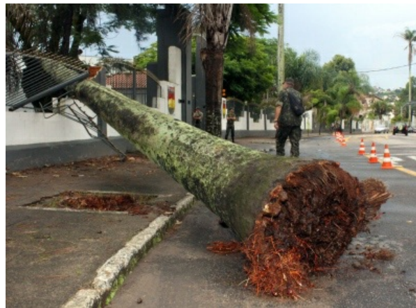
No Mariano Procópio, uma palmeira imperial caiu

A forte chuva que atingiu Juiz de Fora na tarde desta quinta-feira (15) não resultou em registros de ocorrências na Defesa Civil e no Corpo de Bombeiros, mas causou alagamentos e deixou o tráfego lento em vários pontos. Na Rua Paracatu, entre os Bairros Quintas da Avenida e Bandeirantes, região Nordeste, a precipitação, seguida de queda de granizo, resultou em pontos de inundação ao longo da via. Por conta de obras em encostas, a lama invadiu a pista na altura dos números 970 e 1.400, o que levou os motoristas a reduzirem a velocidade. No Bairro Mariano Procópio, mesma região, uma palmeira imperial, com altura equivalente a um edifício de três andares, caiu sobre a calçada da Rua Mariano Procópio, atingindo o muro da 4ª Brigada de Infantaria Motorizada do Exército. Na Avenida dos Andradas, próximo à Rua Silva Jardim, na área central, comerciantes precisaram limpar as lojas após a chuva. As bocas de lobo não teriam conseguido absorver a água, causando alagamentos durante cerca de meia hora.